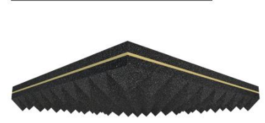
BARİYERLİ PU/E FOAM BARRIER PU/E FOAM