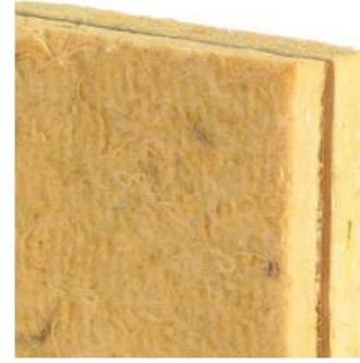
TECSOUND 2FT BARIYER TECSOUND 2FT BARRIER